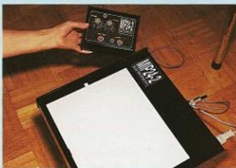
Fotografía de las yemas de los dedos de las manos con cámara Kirlian. En la foto inferior, detalle de los mandos de la cámara

Aplicada a la medicina, la fotografía Kirlian es, pues, una reflexión energética de una parte del cuerpo del paciente. Esta reflexión energética no es en realidad ni la parte psíquica ni la somática del paciente sino el eslabón que existe entre las dos. A nivel terapéutico, esta fotografía se puede utilizar como método de observación del estado de salud general del paciente. El método de observación a partir de la fotografía Kirlian puede usarse para prescribir un tratamiento,